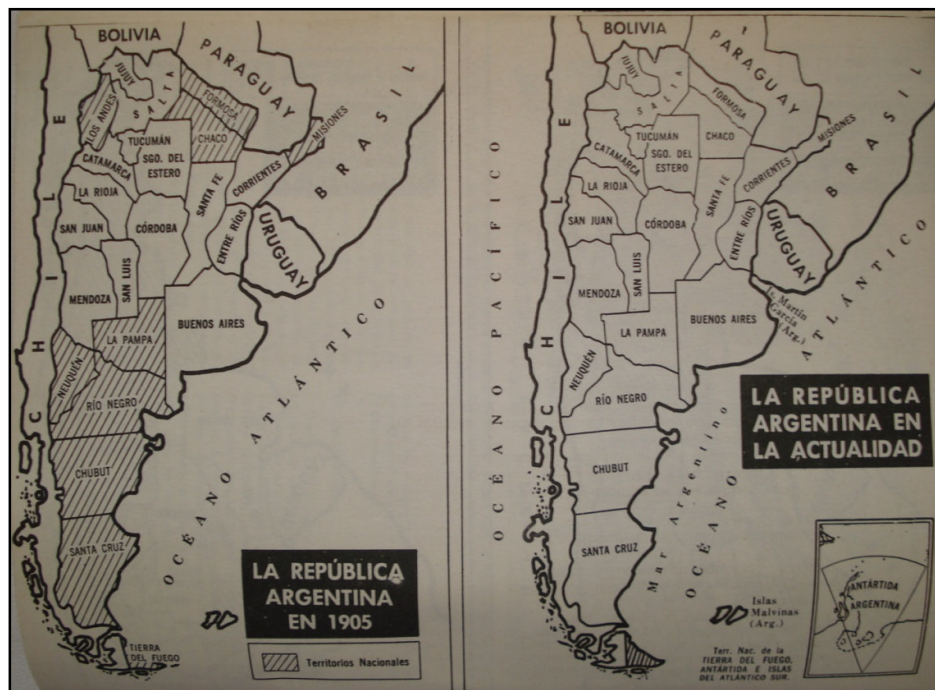
Figura 3. Mapa de la República Argentina. 1905 y en la actualidad.