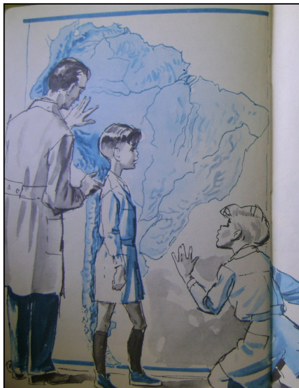
Figura 4. “La espina dorsal de América” en Pogliano (1981), libro de lectura para 5° grado.

asentando una semejanza entre la cabeza, los pies y el largo del territorio argentino, entre los Andes y la columna vertebral del niño [Figura 4].