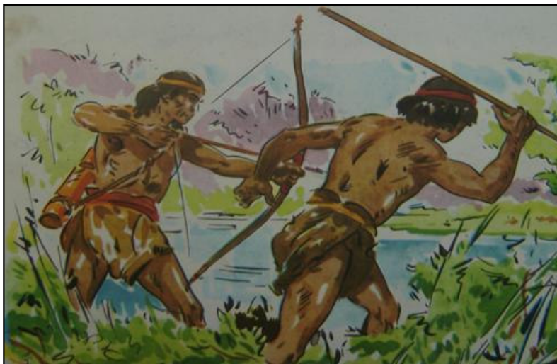
Figura 1. “Vida de los Indios” en Crespo de Julia (1967), libro de lectura para 2° grado.